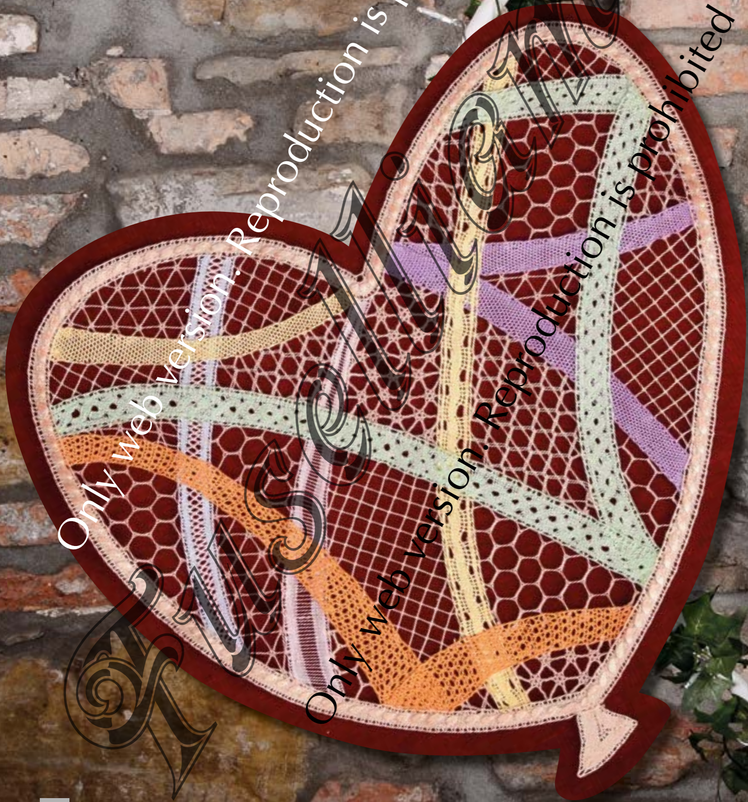
Lavoro realizzato da Fiorenza Fasini